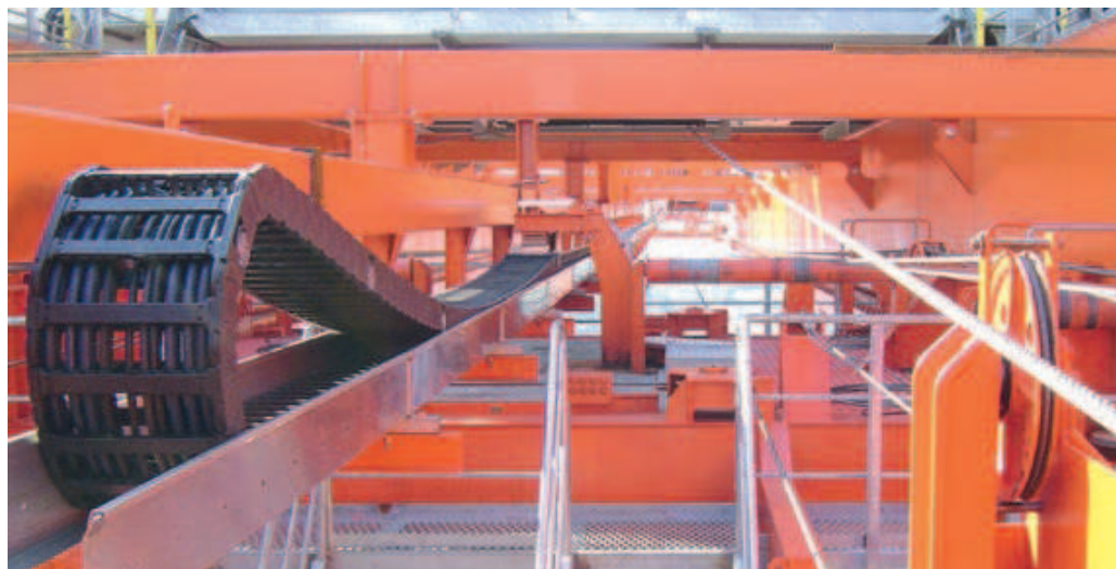
Energieeffiziente igus® E4 Rollen e-kette® in einer Stahlrinne - spart Antriebsleistung