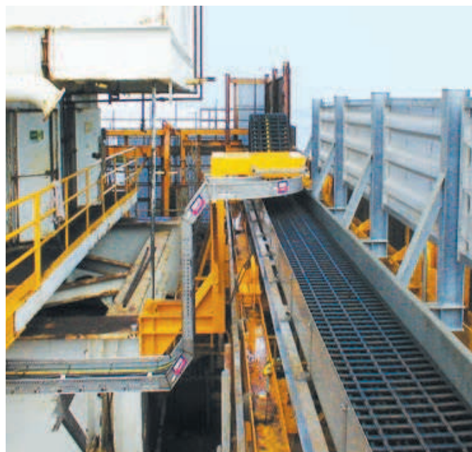
E4 e-kette® mit mehreren Mittellaschen für extreme Füllgewichte auf langem Weg und rauer See - geführt in igus® Stahlrinne